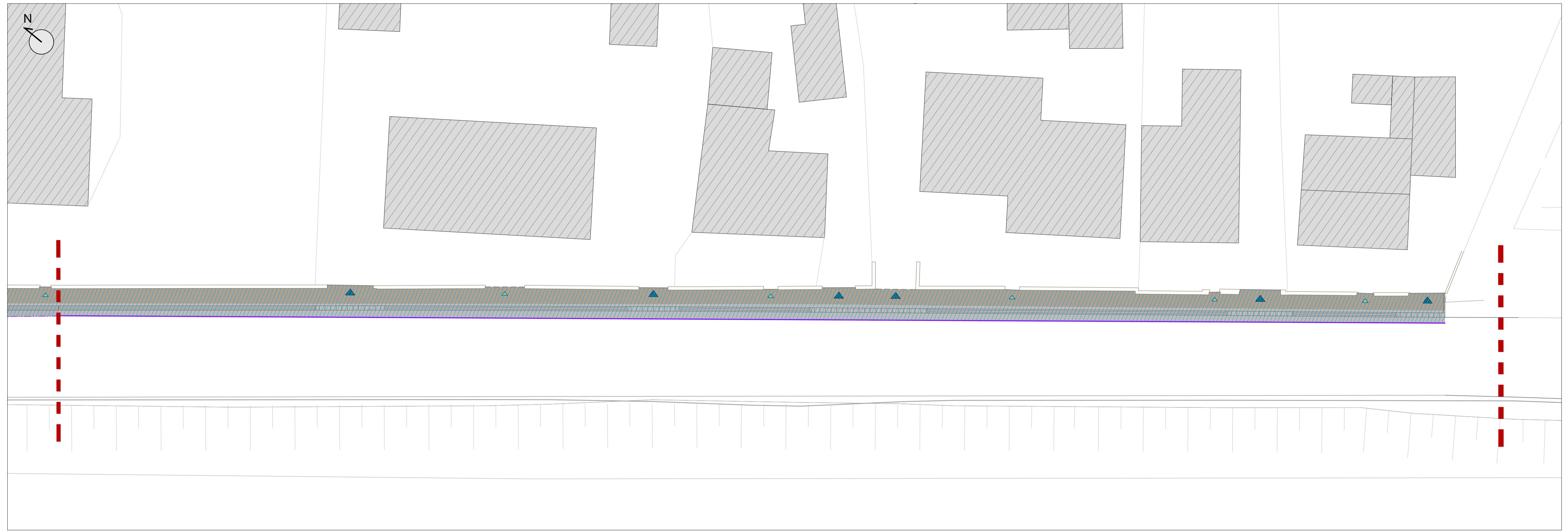
Planimetria 01 - Demolizioni e scavi, scala 1:200