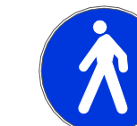
Figura II 88 Art. 122 PERCORSO PEDONALE