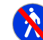
Figura II 89 Art. 122 FINE DEL PERCORSO PEDONALE

N.B. La segnaletica verticale ed orizzontale di progetto dovrà essere preventivamente concordata con la Polizia Municipale competente sia al fine di garantire il rispetto del C.d.S., sia per dare soluzione di continuità ad eventuali nuove criticità emerse.