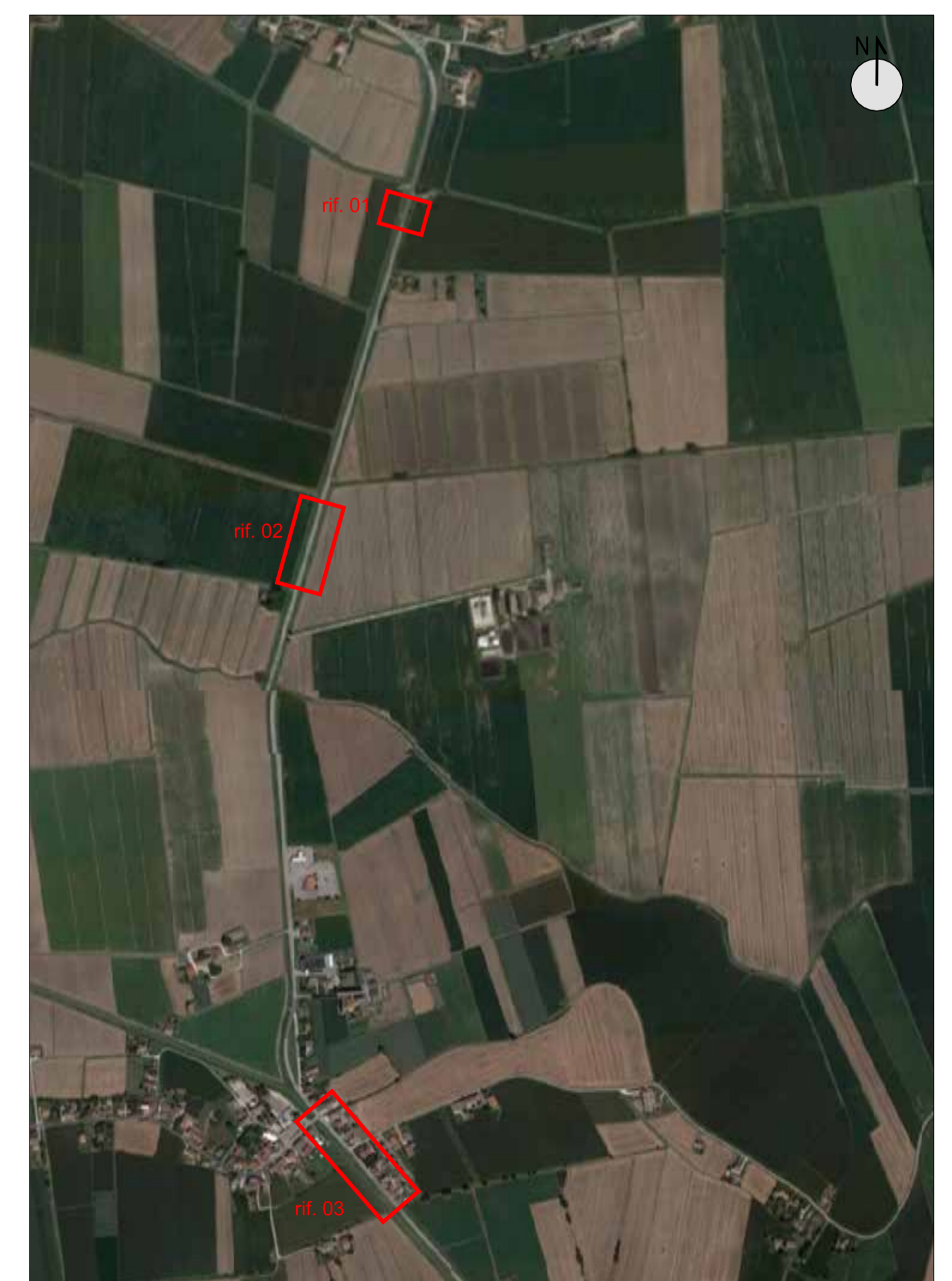
ESTRATTO DI ORTOFOTO scala 1:10.000