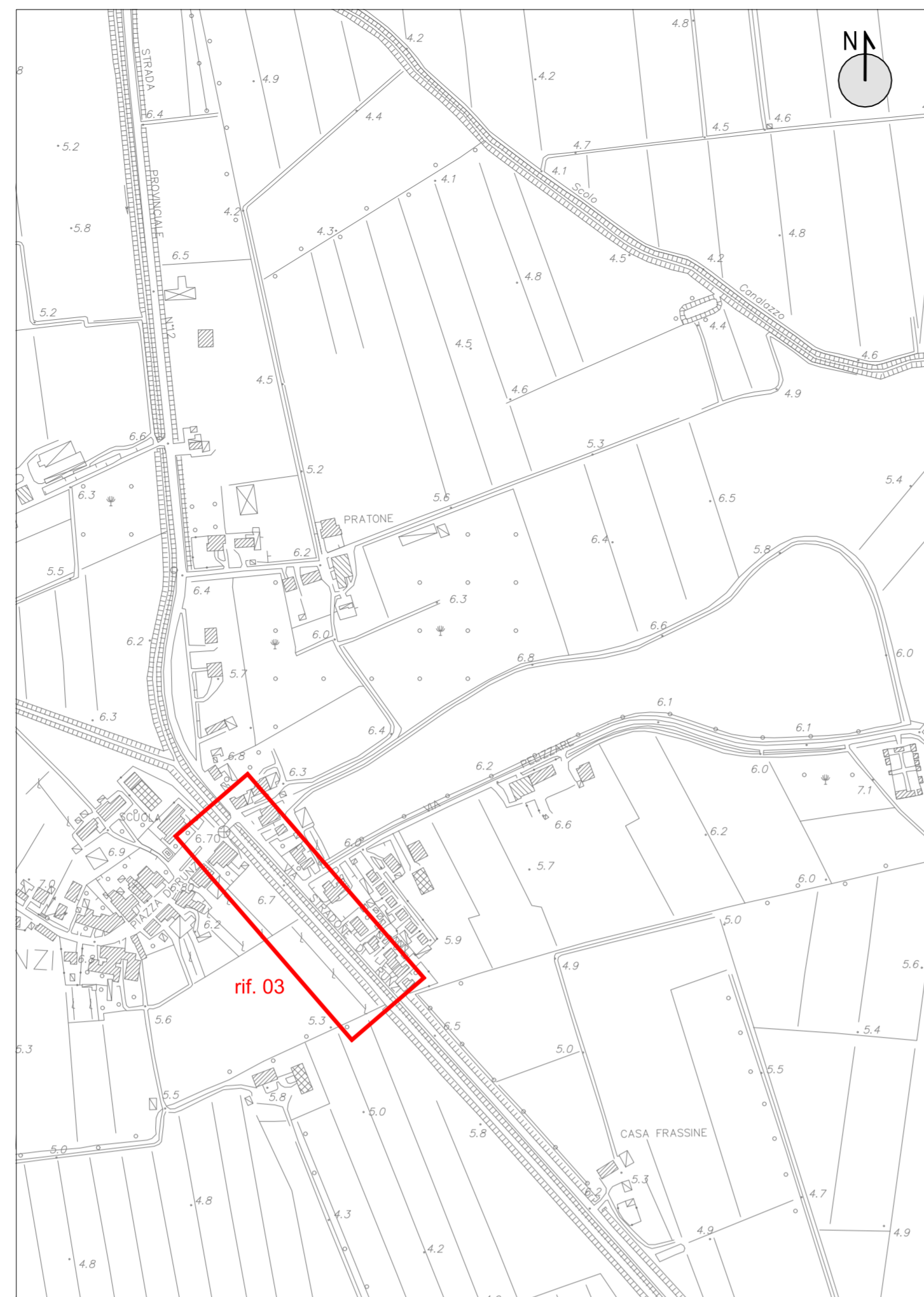
ESTRATTO DI CARTA TECNICA REGIONALE scala 1:5000