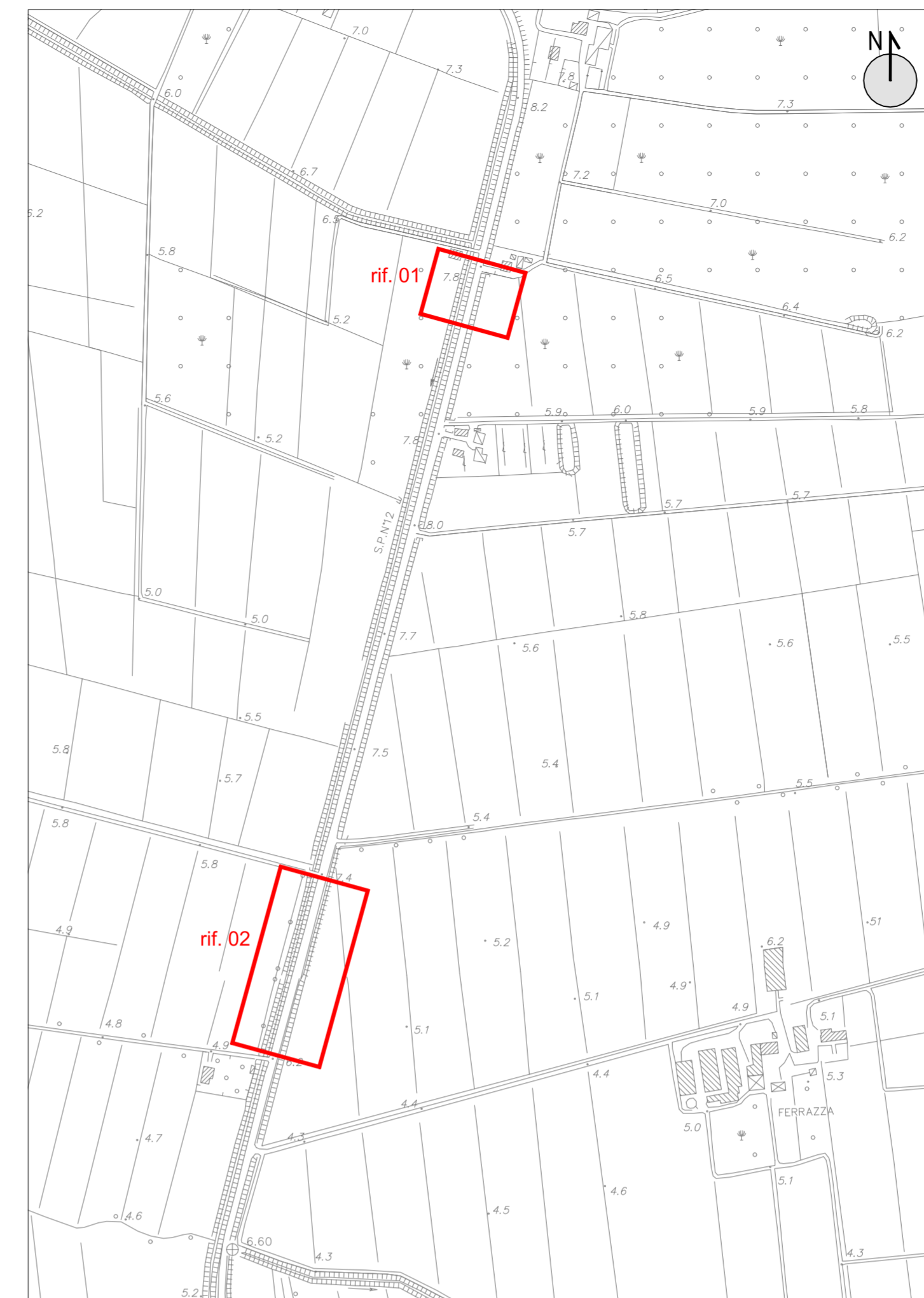
ESTRATTO DI CARTA TECNICA REGIONALE scala 1:5000