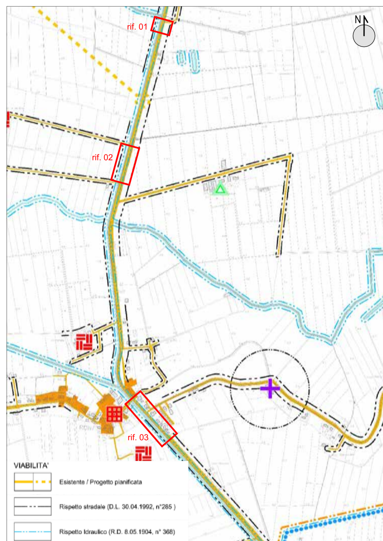
ESTRATTO DEL P.A.T.I - Carta dei Vincoli e della Pianificazione Territoriale scala 1:10.000