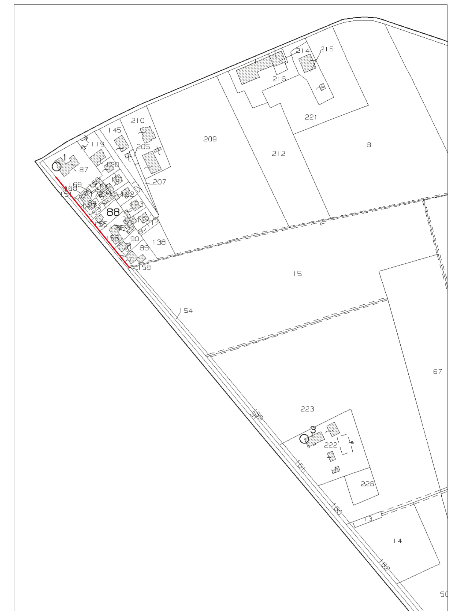
ESTRATTO DI MAPPA CATASTALE scala 1:1000