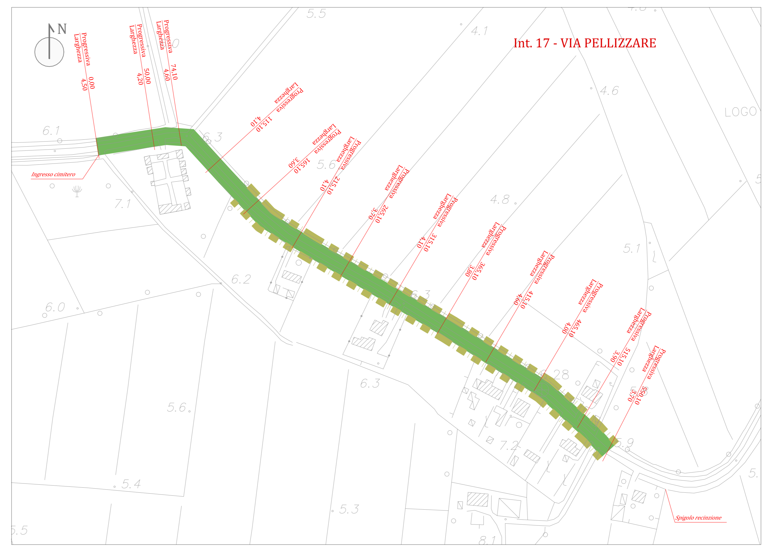
PLANIMETRIA: Intervento 17 - via Pellizzare