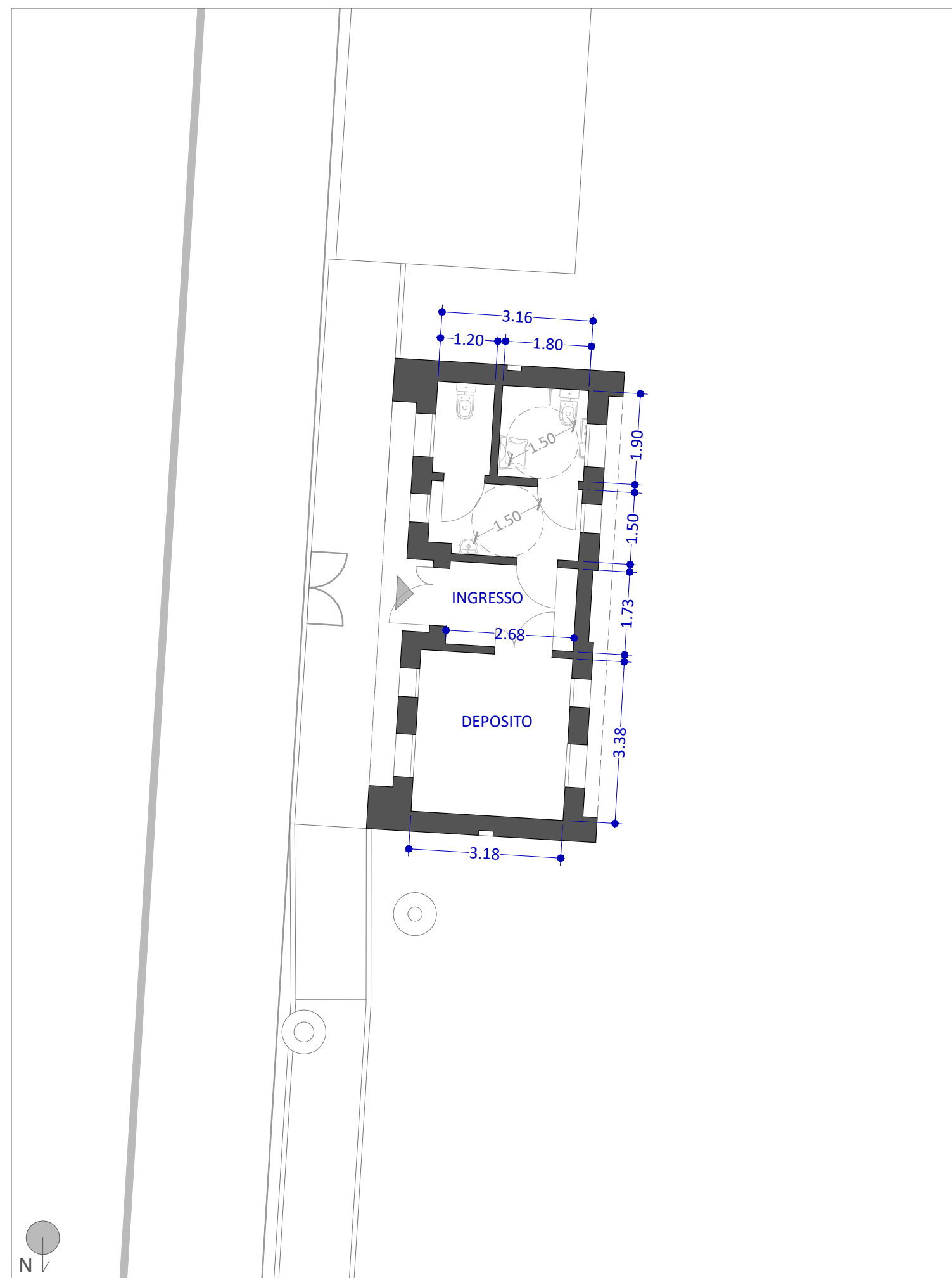
Planimetria stato di progetto - Scala 1:100