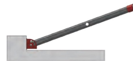
Sezione parapetto reclinabile frontalmente