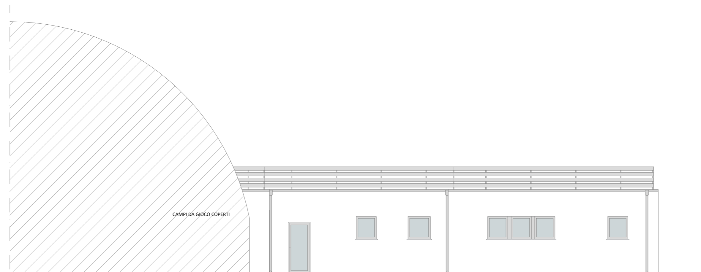
Prospetto nord - scala 1:100