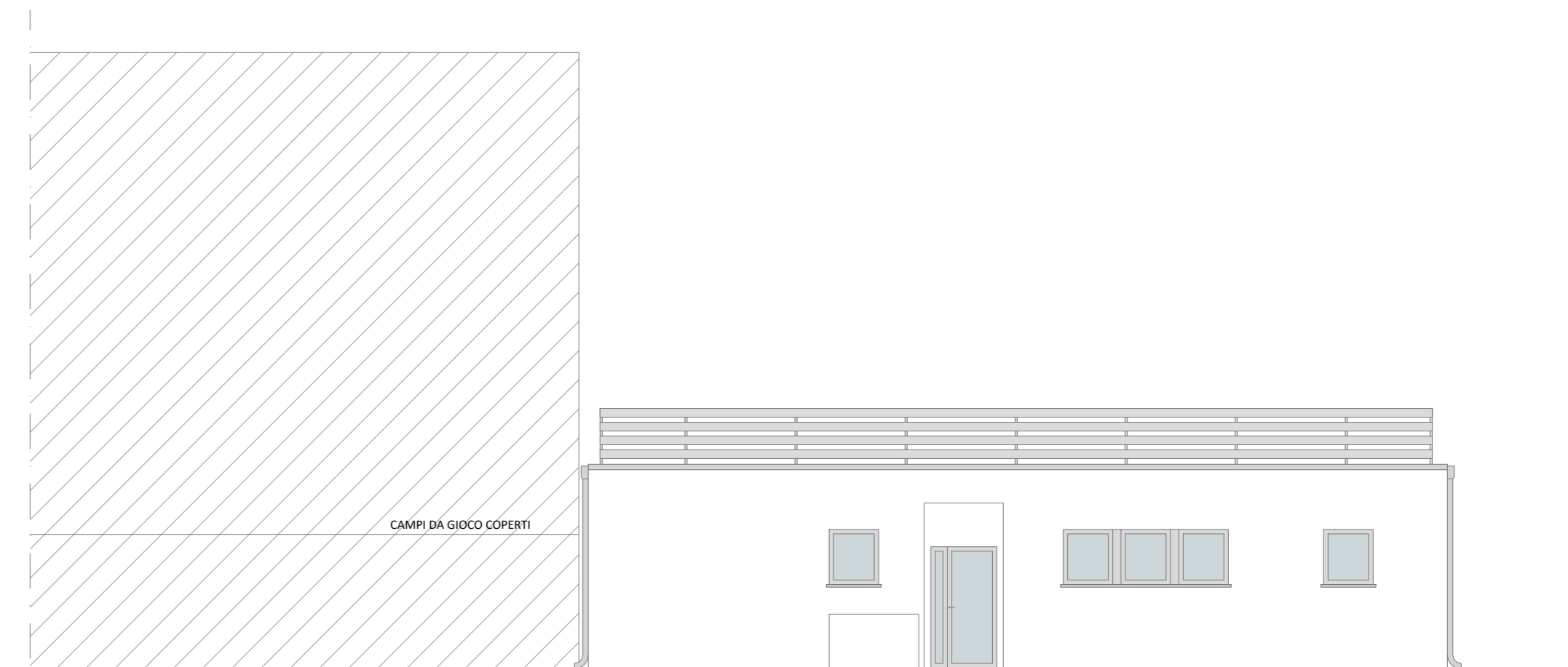
Prospetto ovest - scala 1:100