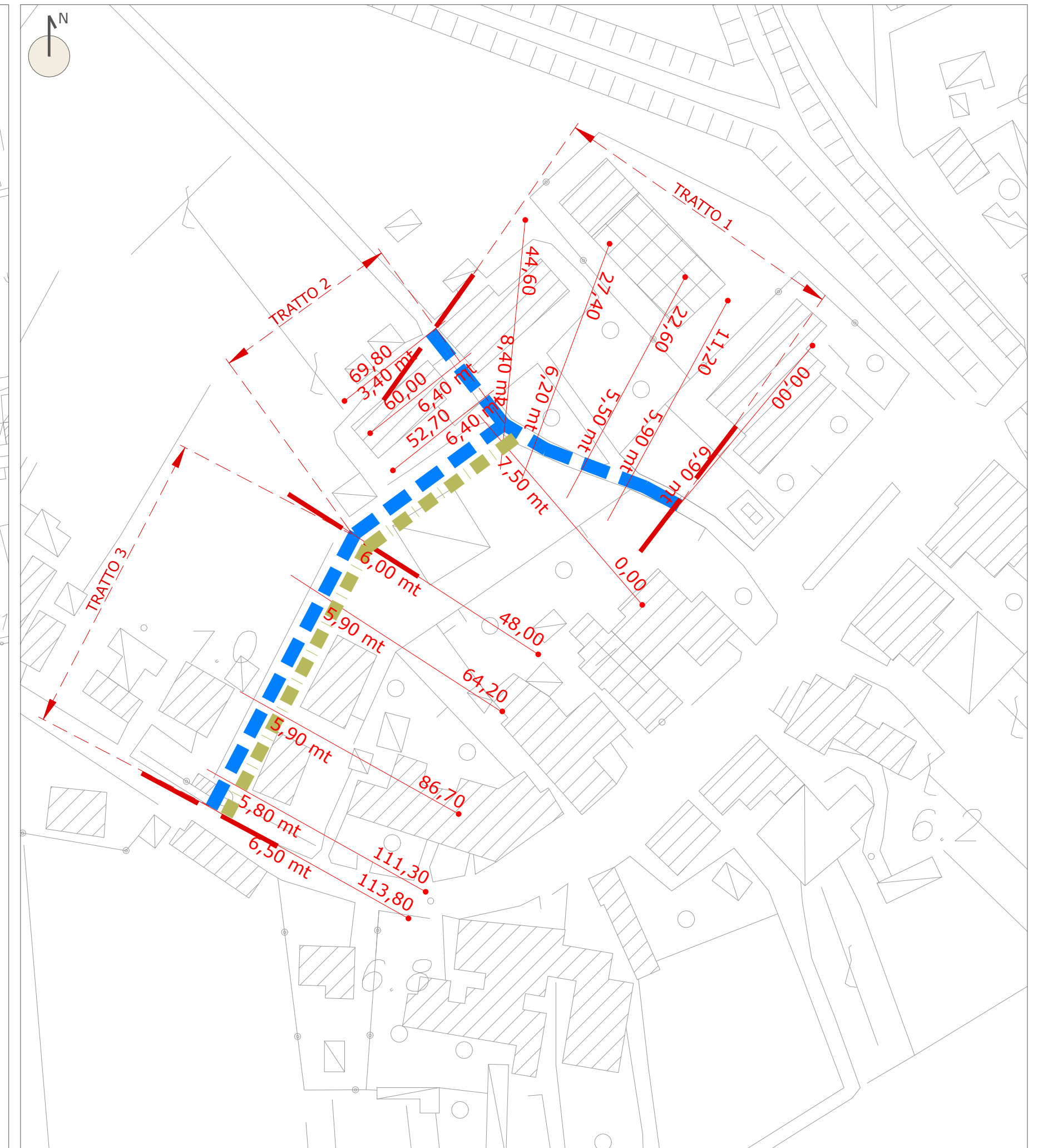
STATO DI PROGETTO: Laterale Piazza Runzi - scala 1:1000