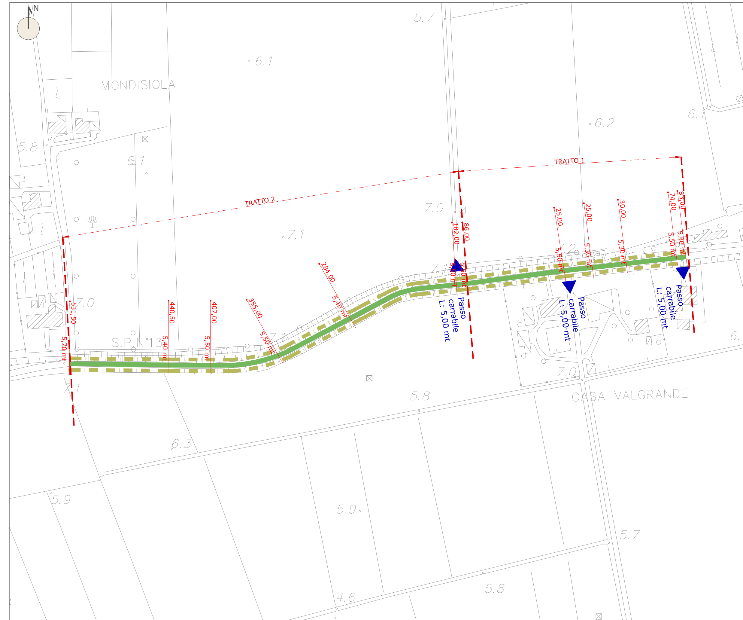
STATO DI PROGETTO: Via Riviera - scala 1:2000

Vietata la riproduzione senza preventiva autorizzazione dello studio di progettazione